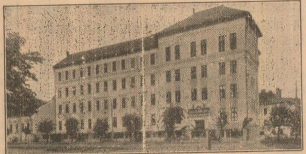
Școala Normală din Deva.

Este o măsură îmbucurătoare, cu atât mai îmbucurătoare pentru noi hunedoreni cu cât școala normală de băieți din Deva face și ea parte din cele 10 școli selecționate, primind astfel în clasa I-a 30 de elevi, al căror examen de primire va începe în ziua de 9 Septembrie.