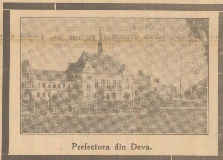
Prefectura din Deva.

Astăzi prăznuind o bătălie, noi nu prăznuim un simțământ războinic, ci prăznuim un simțământ al conștiinței dreptății noastre naționale. România și întregul său popor nu dorește să se lupte, dar mărturisește prin amintirea zilelor sale glorioase, că va fi gata, ca altădată aici la Mărășești, să-și apere dreptul său, să-și apere țarina strămoșească. Trăiască România!