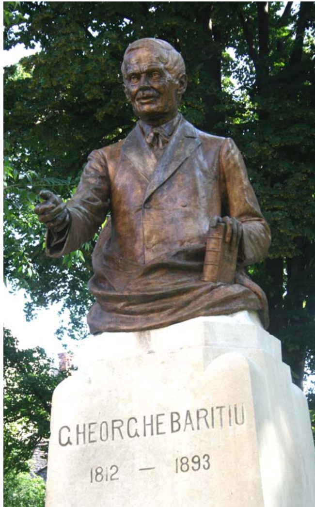
Gheorghe Barițiu (1812-1893)