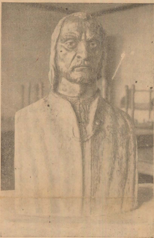
Bustul eroului CRIȘAN.

care e Zarandul, acum când pe plaiurile lui plutește aerul libertății, să fie siguri dușmanii noștri, că va crește fii și mai bravi, hotărâți a-și apăra brazda,