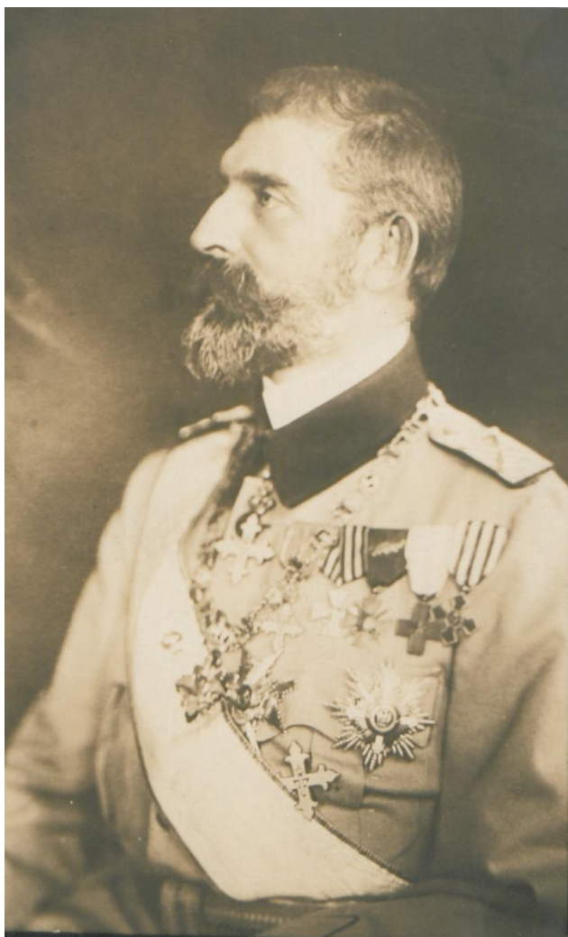
Regele Ferdinand Întregitorul.