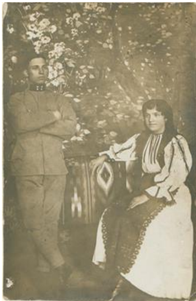
Familie de sălișteni în timpul Marelui Război.