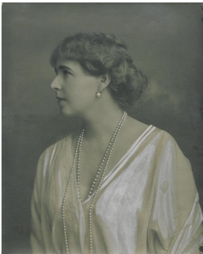
Regina Maria.