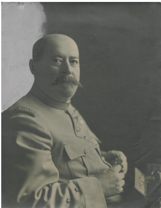
Generalul Henri Mathias Berthelot.