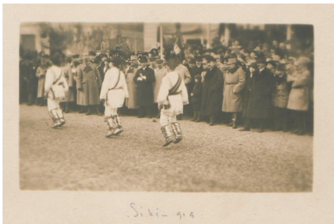
Primirea Generalului Henri Mathias Berthelot în Sibiu. (2 ianuarie 1919)