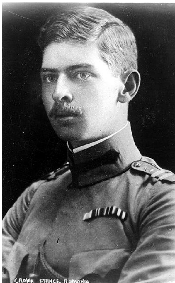
Prințul Moștenitor Carol