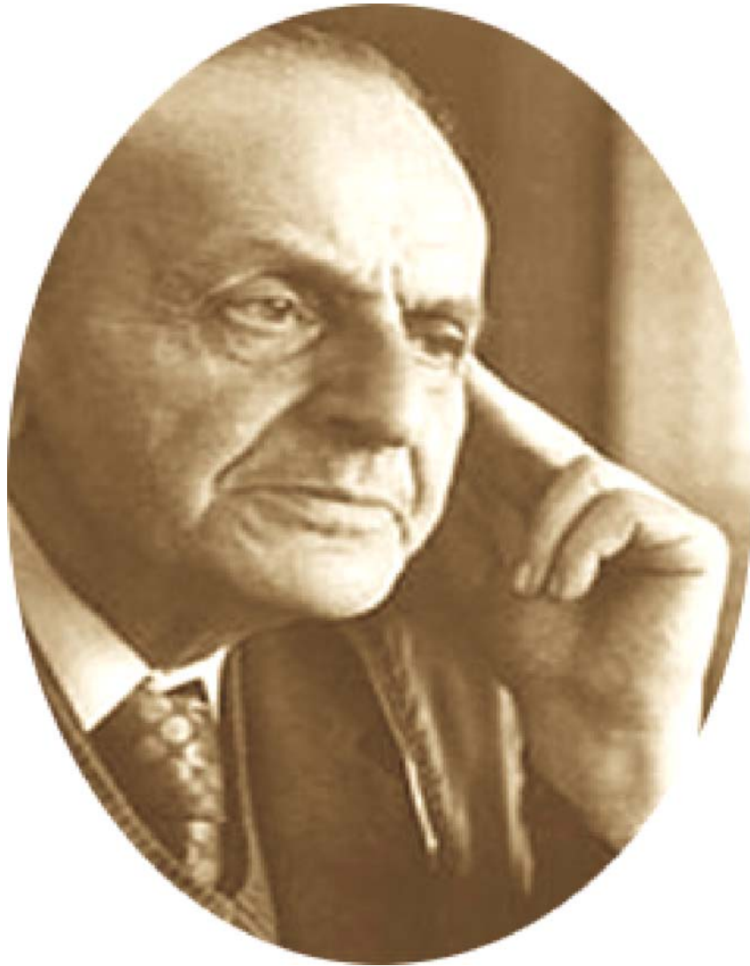
Constantin Noica (1909-1987)