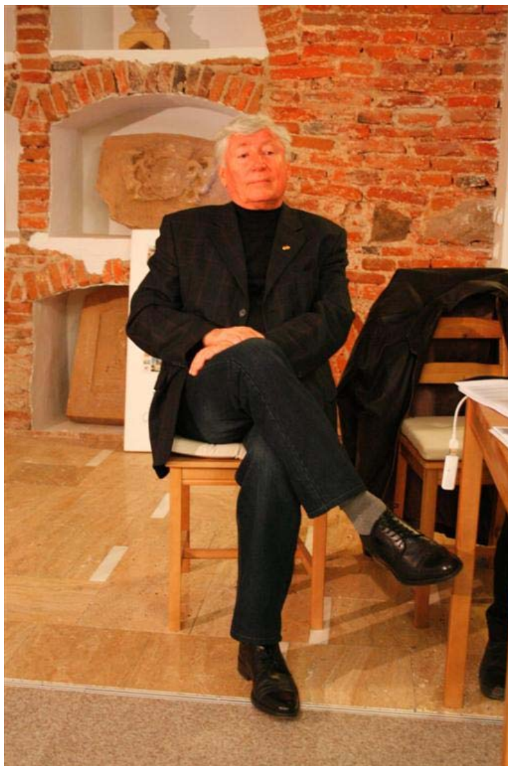
Vasile Crișan (n. 1945)