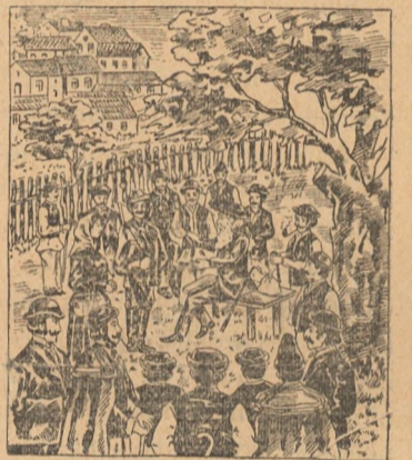
Petru Vidmarics explică minunatul efect al Picăturilor de Pakracz