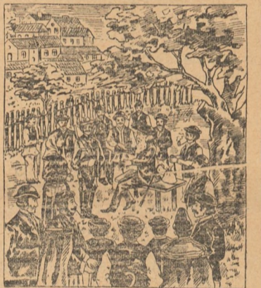
Petru Vidmarics esplică minunatul efect al Picăturilor de Pakracz