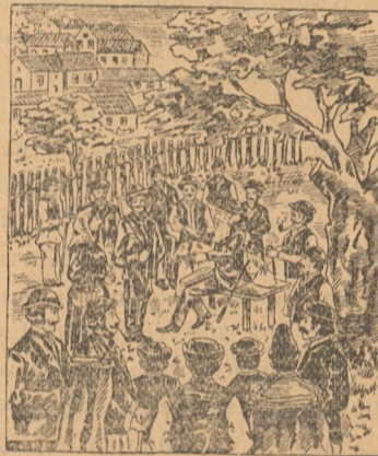
Petru Vidmarics esplică minunatul efect al Picăturilor de Pakracz