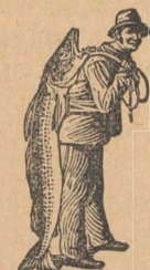
Veritabil numai cu această marcă — Pescarul — ca semn de garanție al experientelor lui SCOTT.