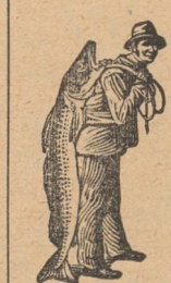
Veritabil numai această marcă — Pescarul — ca somnul garanției al experților lui Scott