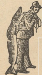
Veritabilă năma cu această marcă — Pescarul — ca semnul garanției a experiențelor lui SCOTT.

Prețul unei sticle originale c. 2-50. Se găsește în toate farmaciile.