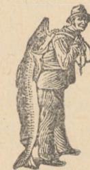
Veritabil numai cu această marcă — Pescarul — ca semnul garanției și experienței lui SCOTT.