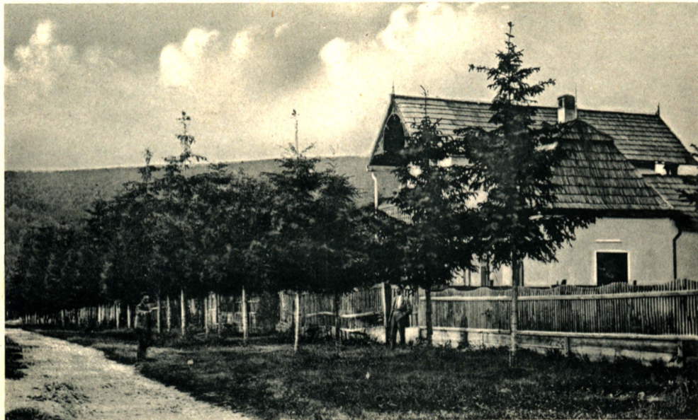
Baia Covasna fürdő