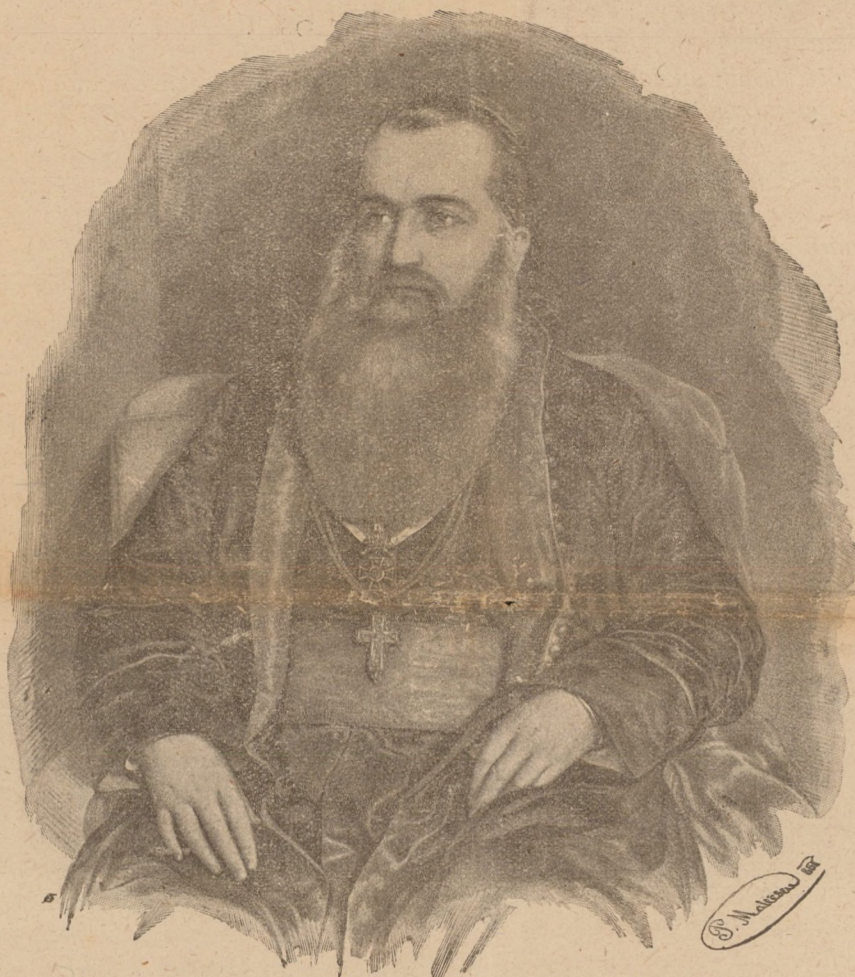
ANDREI ȘAGUNA EPISCOPI, 1855 (Portret de Mateescu)

și a îndrumat Reuniunea Meseriașilor din Sibiu. Ingrijindu-se de formarea unor bărbați capabili să conducă aceste instituții, Șaguna a trimis tineri la universități din străinătate, iar pentru alimentarea neconținută a școlilor