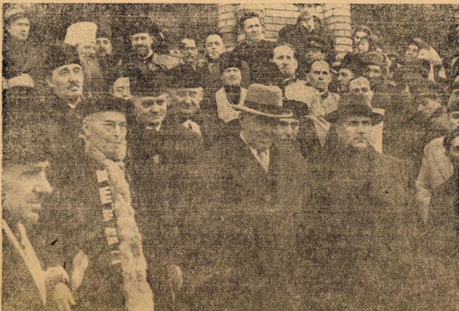
Inalții paspeși cu re- prezentanții cultelor la înscăunarea I. P. S. Mitropolit IUSTIN.

Erau realități istorice de pe vremuri și interesele imperialiștilor care au deter- minat trecerea unei părți a romînilor ar- deleni la uniație, dar realitățile istorice nu stau pe loc, ele s-au dezvoltat, s-au des- fășurat și s-a dovedit pentru fiecare minte clară că această dezbinare în decursul celor două veacuri nu ne-a folosit ci ne-a pricinuit foarte mult rău. Eu am trăit acea- stă dezbinare o viață întregă. Tatăl meu a fost și el un preot ortodox și și-a făcut datoria, așa cum trebuie. Apoi bunicul meu atît cel după mamă, cit și cel după tată, și străbunii mei toți au fost preoți orto- docși romîni. Am văzut în interiorul acestei