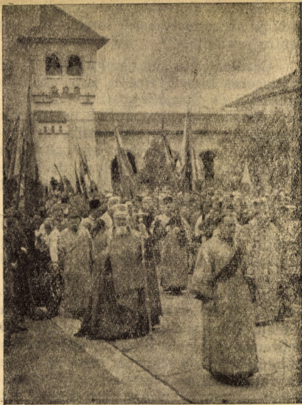
La „Catedrala reîntregirii bisericești” din Alba-Iulia (21 octombrie 1948)

Cum? — Prin religie. Așa și-a pus în mișcare generalii și cătanele, guvernul și slujbașii și a reușit în 1698 să silească pe cîțiva protopopi (38 din 54 cîți erau în Ardeal) să declare că ei se unesc cu catolicii. Dar și aceștia au zis: așa ne unim, ca legea noastră strămoșească să rămîna neschimbată. Așa s-a început