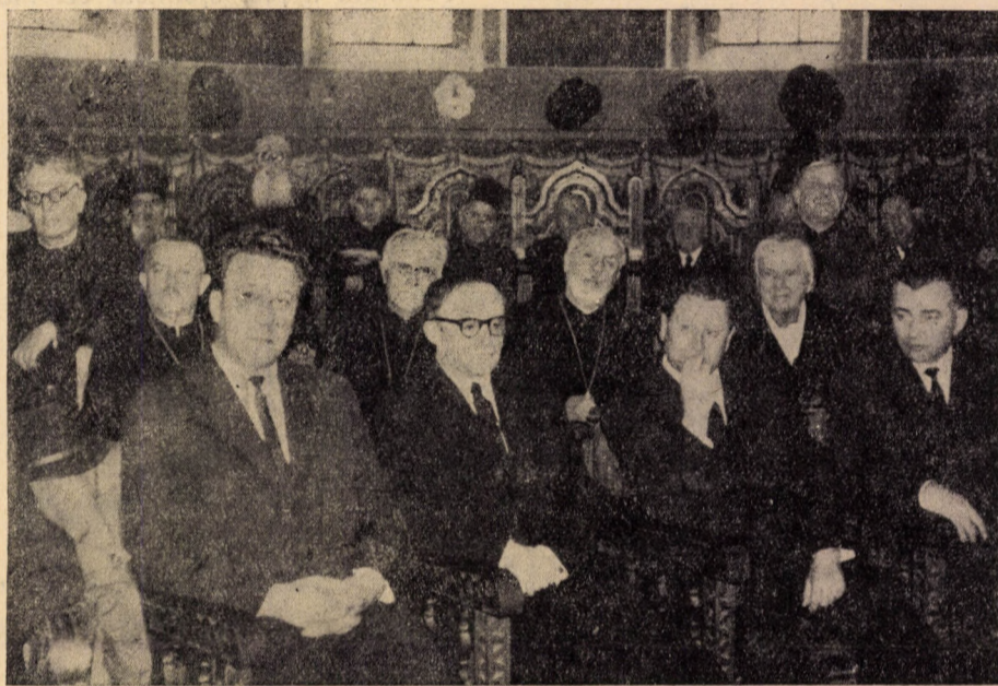
Reprezentanți ai organelor de Stat la funeralii.

Rugînd pe Dumnezeu să odihnească pe cel adormit în împărăția Sa, încheie cu cuvintele Mîntuitorului: „Eu sînt învierea și viața. Celce crede în Mine, de va și muri, viu va fi“ (Ioan 11, 25).