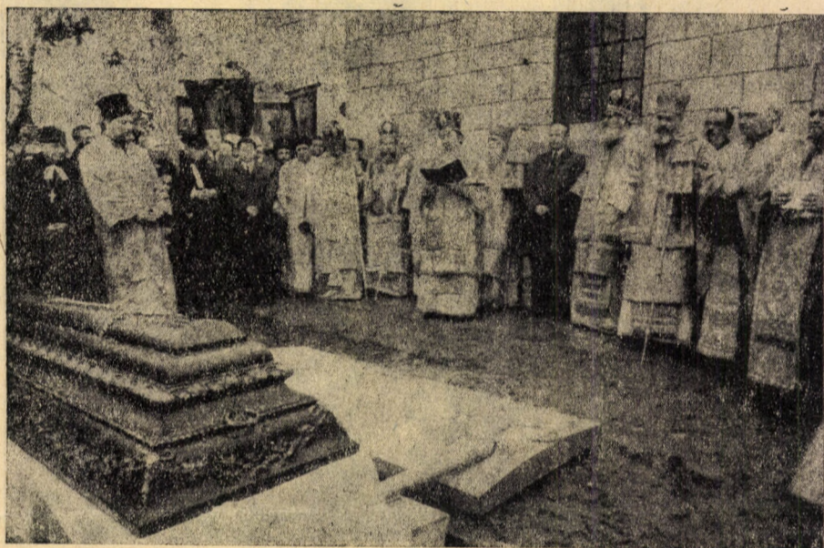
În fața mormîntului de la Rășinari.