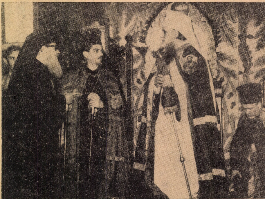
Prea Fericitul Patriarh JUSTINIAN, I. P. S. Mitropolit IUSTIN al Moldovei și Sucevei și I. P. S. Mitropolit NICOLAE al Ardealului — la instalare

Mulțumesc clerului de la Centrul Arhiepiscopesc și de la protopopiate și parohii și credincioșilor pentru dragostea cu care