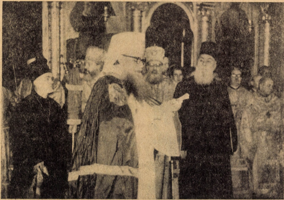
Prea Fericitul Patriarh JUSTINIAN rostește cuvîntarea de instalare