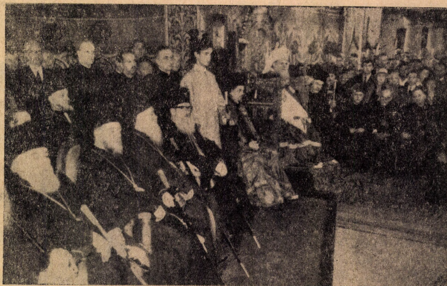
În timpul citirii Gramatei: Înalți Ierarhi, preoți și credincioși