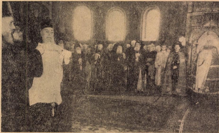
In Catedrala mitropolitană din Sibiu, la solemnitatea instalării. — Citirea Gramatei patriarhale —

Sîntem siguri, Inalt Prea Sfințite, că veți contribui la zidirea acestei lumi pe care o așteptăm cu toții și vă felicităm de pe acum pentru izbînzile pe care nu veți întîrzia a le secera ca Arhipăstor al Bisericii Ardelene.