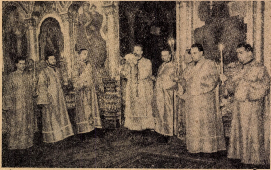
În timpul Sf. Liturghii — la instalare

În aceste momente nu pot spune nimic altceva decît întru uimire să grăiesc cu psalmistul: „Minunate sînt lucrurile Tale Doamne“ (Ps. 103, 24). Căci cu o săp-