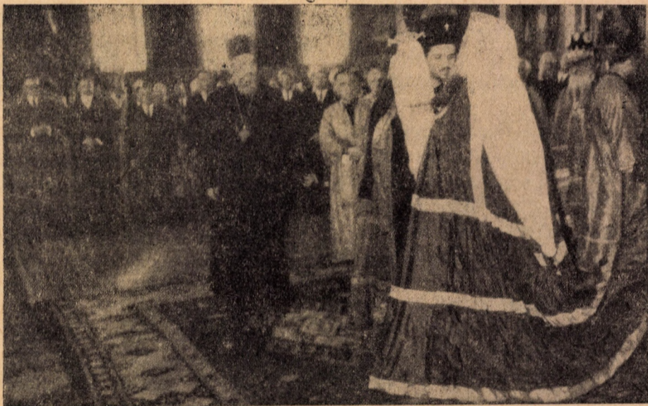
La solemnitatea instalării