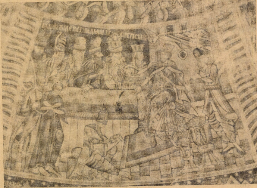
Iisus în fața lui Pilat. Acuzatorii în costume de epocă. (Frescă de la biserica din Fofeldea)

impilărilor naționale, împotriva asuprii și nedreptăților de tot felul, de care poporul nostru a avut atîta parte în zbuciumatul său trecut. Ne sînt cunoscute în această privință scenele cu adînc înțeles istoric pe care le găsim spre exemplu pe pereții pictați în exterior ai unor biserici din nordul Moldovei.