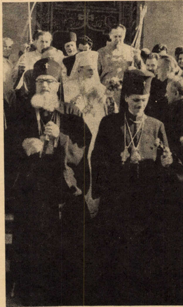
La ieșirea din Catedrală, după Sf. Liturghie.

P. S. Sa încheie cu declarația: „Adevărata noastră Biserică nu poate fi decît Biserica Ortodoxă Română în frunte cu Prea Fericitul Patriarh Justinian“.