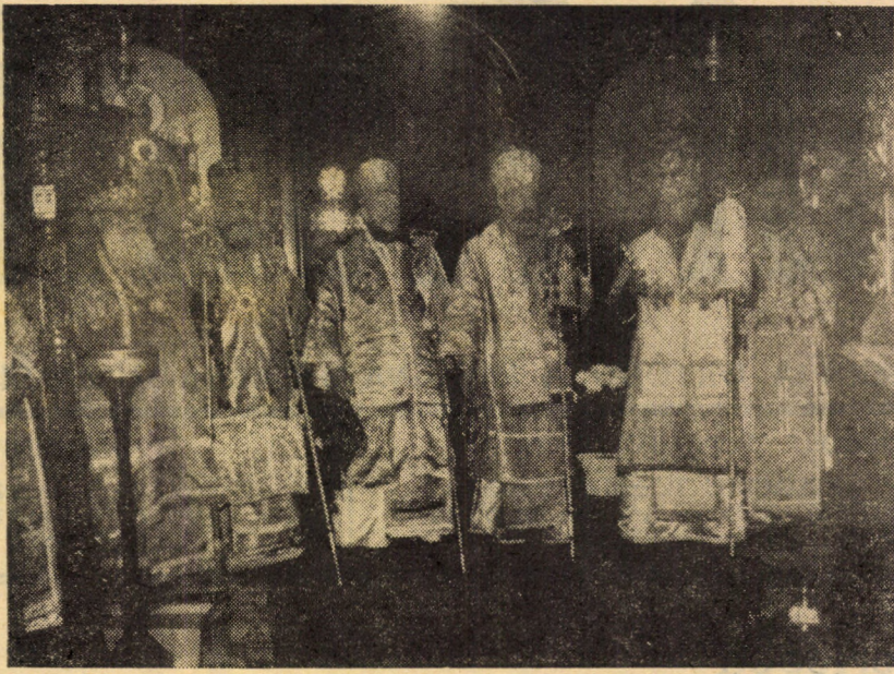
Alba Iulia, 21 octombrie 1968. — Soborul Ierarhilor slujitori.

tre, în parohiile noastre, în întreaga Biserică. Și noi toți avem rîvna nestinsă de a ne dăruî cît mai deplin pentru ca Biserica noastră să vieze după dreapta credință — și sîntem mîndri de viața ei spirituală, de legăturile ei frățești cu celelalte Biserici din țară și străinătate, de prestigiul ce-l are în lume ca luptătoare pentru pace și înfrățire între popoare.