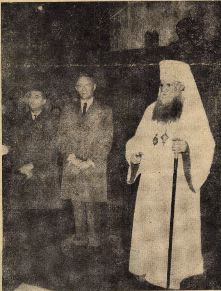
ALBA IULIA, 21 OCTOMBRIE 1968

atunci — pentru că vremea despărțirii dintre frați pare că aparține unui trecut îndepărtat, care azi nu mai are nici un ecou, decît acela de a ne aduce aminte re-lele dezbinării și a scoate mai puternic în lumină foloasele unității. E mult de-atunci, pentru că așa ne-am obișnuit cu viața înfrățită încît ni se pare că așa a fost „de cînd lumea”, că niciodată n-am fost despărțiți. Și sîntem fericiți că așa este.