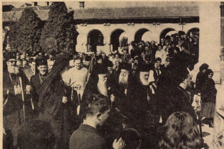
Alba-Iulia, 21 octombrie 1968. Membri ai Sf. Sinod după ieșirea din Catedrală.