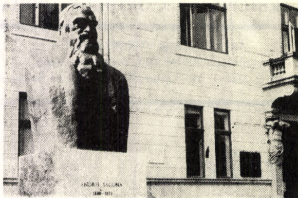
Bustul mitropolitului Andrei Șaguna din parcul Astra Sibiu

gare a culturii, dar și unul de făurire a unei ideologii comune românești. Cum importul cărților din Principate era insuficient, iar singura tipografie românească, de la Blaj, nu suplinea lipsa lor, îndeosebi după 1849, circularul lui A. Șaguna din 27 august 1850 anunță fondarea tipografiei diecezane din Sibiu, prin intermediul căreia se urmărea umplerea acestei lacune.