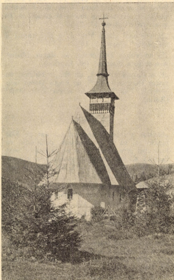
Biserica din Arieșeni

s-a construit o clopotniță metalică, înaltă de 6 metri. Primul dangăt al mult visatului clopot a umplut inimile noastre de bucurie și Munții Apu-