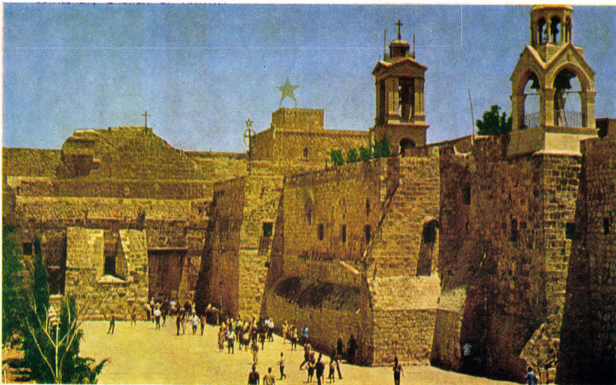
Piața Betleem cu intrarea în biserica Nașterii Domnului

Comori ale spiritualității ortodoxe, ramuri ale unui bogat arbore al culturii românești, colindele aduc în vatra sufletului simțămîntul unirii cu Dumnezeu și cu neamul românesc de pretutindeni.