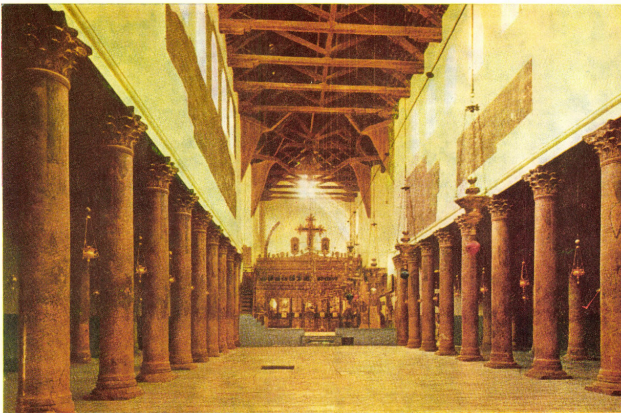
Biserica Nașterii Domnului din Betleem (vedere spre altar)