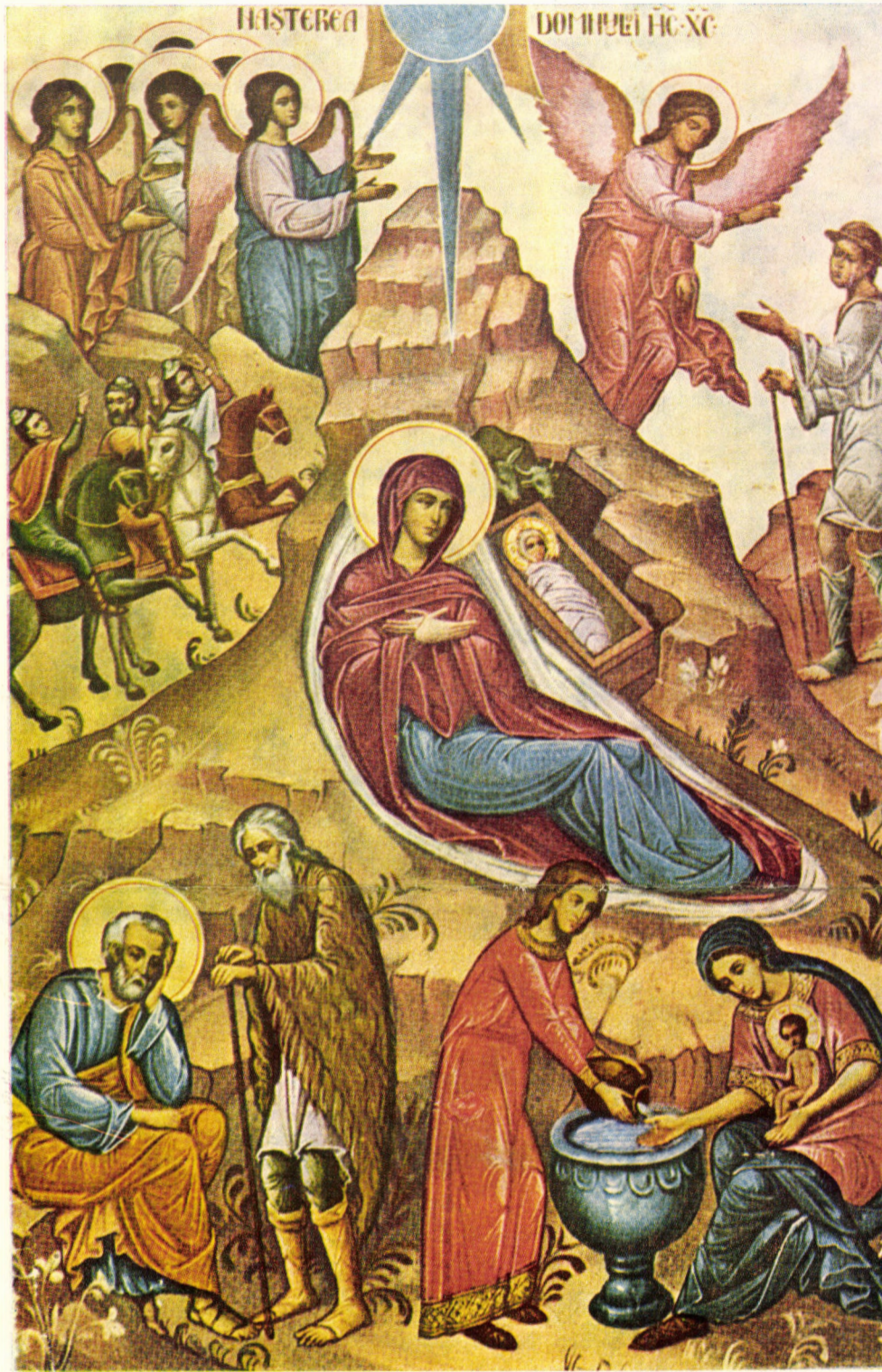
Pictură în frescă executată de Iosif Keber în Catedrala mitropolitană din Sibiu