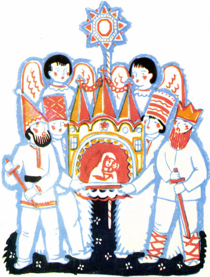
Vifleemul. Desen de Anastase Demian