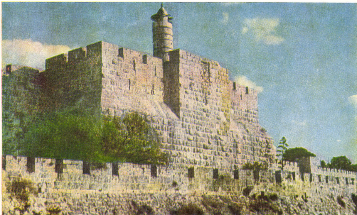
Palatul lui Irod (refăcut pe vechile ruine) la care au poposit magii