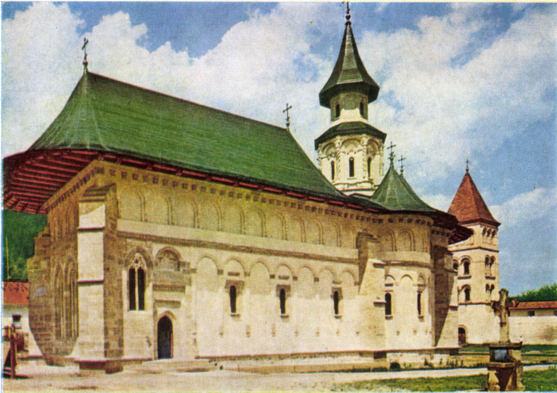
Biserica mănăstirii Putna, ctitoria lui Ștefan cel Mare și necropola sa și a familiei, ridicată între anii 1466—1470, sfințită la 3 septembrie 1470 de mitropolitul Teoctist I.