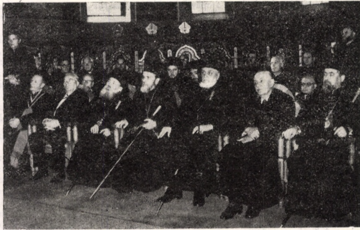
Ierarhii și reprezentanții cultelor la instalare