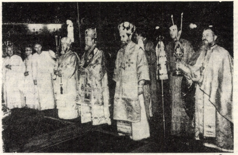
Soborul ierarhilor și slujitorilor la instalare

În numele eparhiilor, cultelor, instituțiilor și organismelor bisericesti pe care le reprezentau, vorbitorii au toastat pentru Conducătorii Patriei noastre, pentru Sfîntul Sinod, în