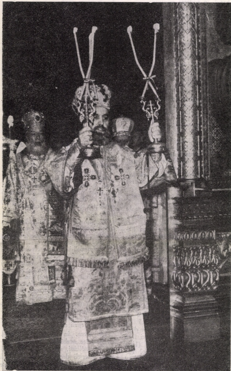
In timpul Sf. Liturghii, la instalare, P.S. Lucian binecuvîntînd credincioșii

Precum s-a relatat anterior (vezi „Telegraful Român” din 1 și 15 august 1980), la propunerea I.P.S. Mitropolit Nicolae al Ardealului, Sfîntul Sinod al Bisericii Ortodoxe Române, în ședința sa de lucru din 16 iulie 1980, a ales pe P.S. Episcop Lucian Florea — Făgărașanul, Vicarul Arhiepiscopiei Ortodoxe Române pentru Europa Centrală și Occidentală, în funcția de Episcop-vicar al Arhiepiscopiei Sibiului.