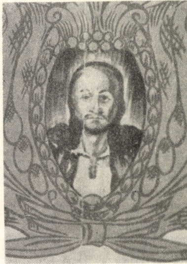
Portretul lui Horea din Catedrala cu Lună

Întîi, ea are în turn un fel de glob în care se indică fazele lunii,