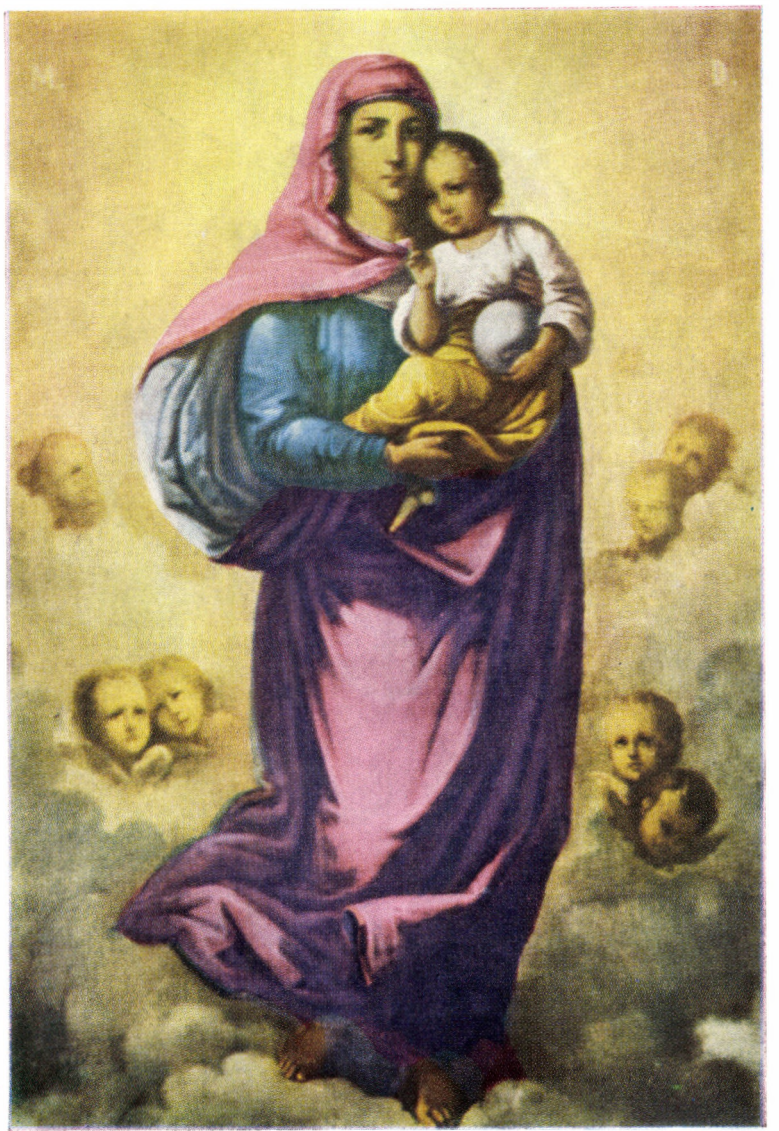
Reproducere după icoana realizată de Nicolae Grigorescu

Ce altă laudă vrednică am putea aduce noi, fiii Bisericii Ortodoxe Române, fiii Maicii Domnului, decît aceea de a fi toți cei ocrotiți de ea duhovnicește, un gînd și o inimă. Un gînd și o inimă, și în dreapta credință, dar și în muncă, în dăruire, în iubire pentru brazda strămoșească, în devotamentul arătat poporului și scumpei noastre țări, al cărui prestigiu este subliniat, afirmat și omagiat mereu pe toate meridianele lumii.