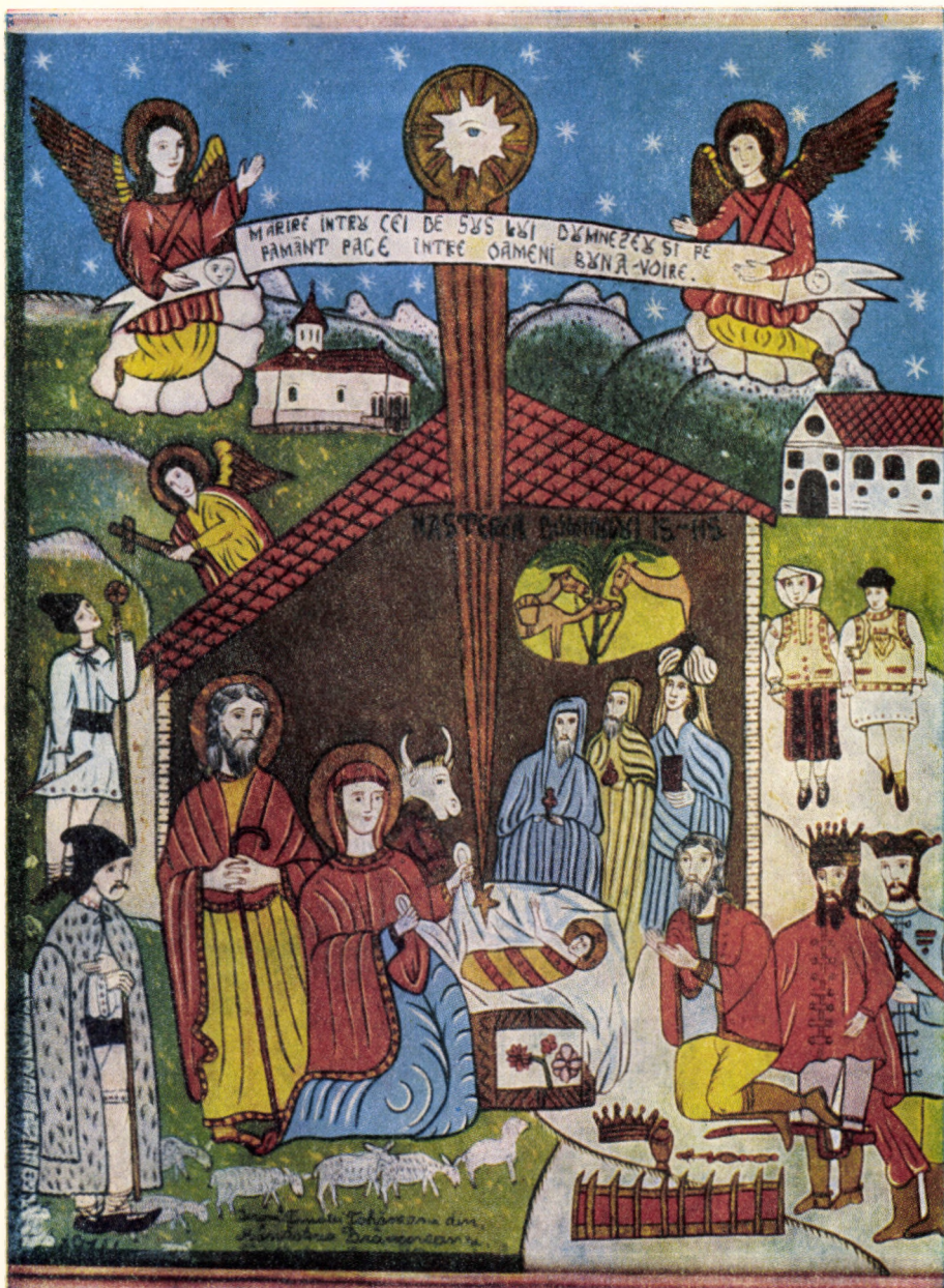
Icoană pe sticlă executată de Arhim. Timotei Tohăneanu de la Mănăstirea Simbăta