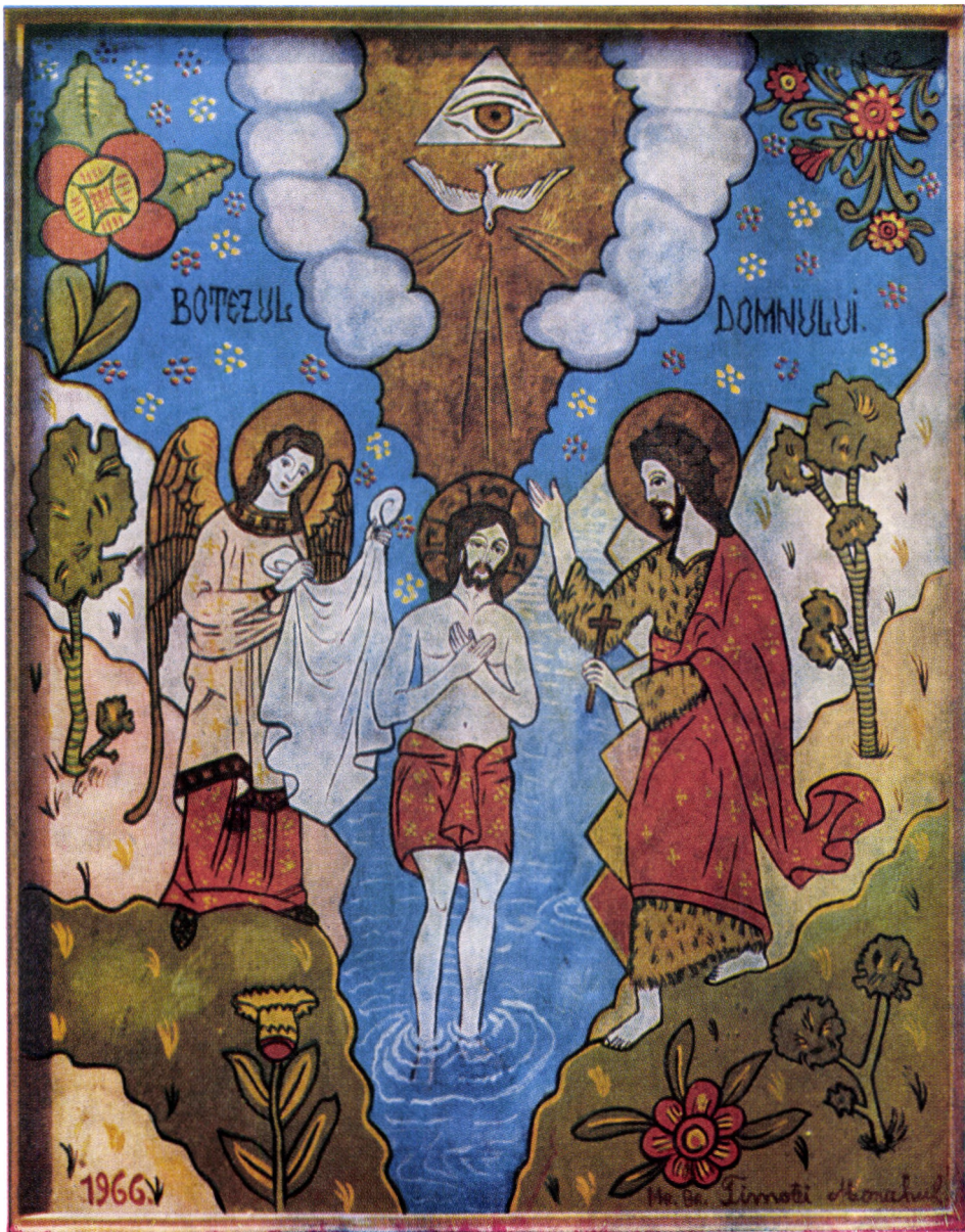
Icoană pe sticlă executată de Arhim. Timotei Tohăneanu de la Mănăstirea Simbăta