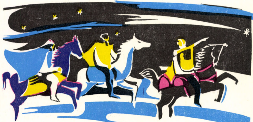
Cei ce slujeau stelelor, de la stea au învățat să te cunoască pe Tine, Soarele dreptății