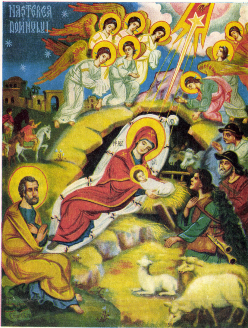
Nașterea Ta, Hristoase, Dumnezeule, răsărit-a lumii lumina cunoștinței