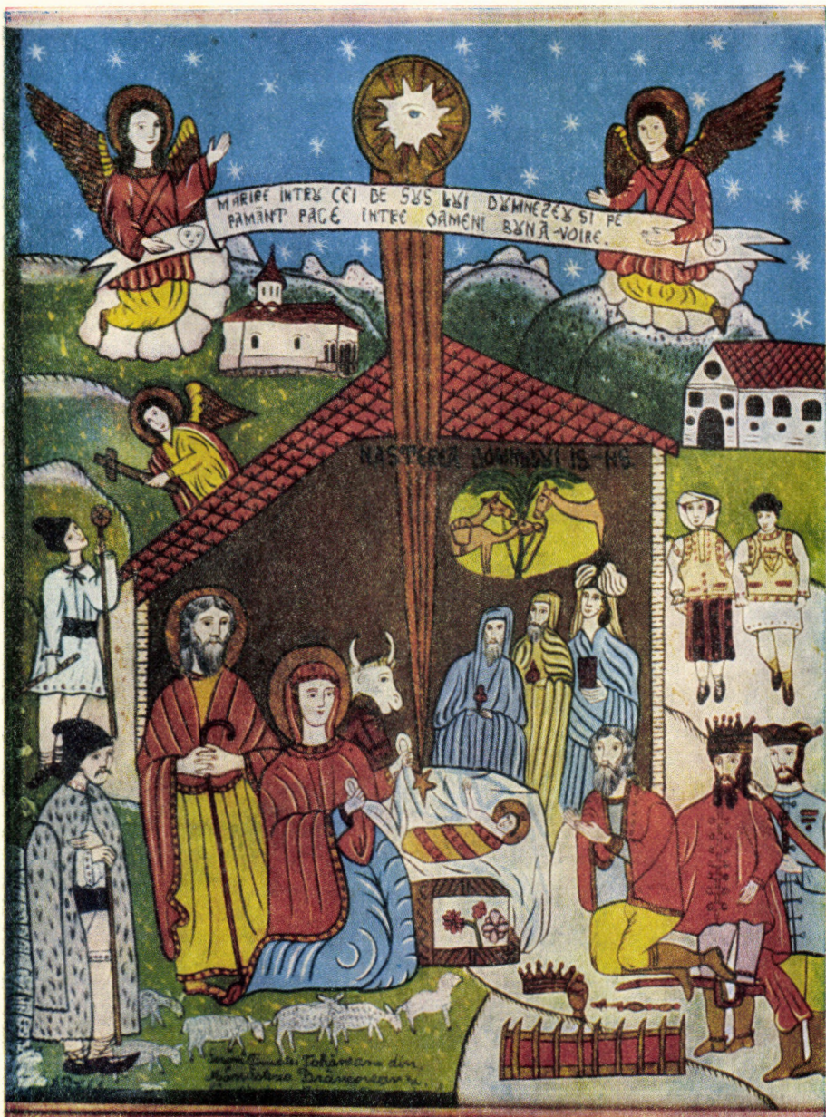
Icoană pe sticlă executată de Arhim. Timotei Tohăneanu de la Mănăstirea Simbăta