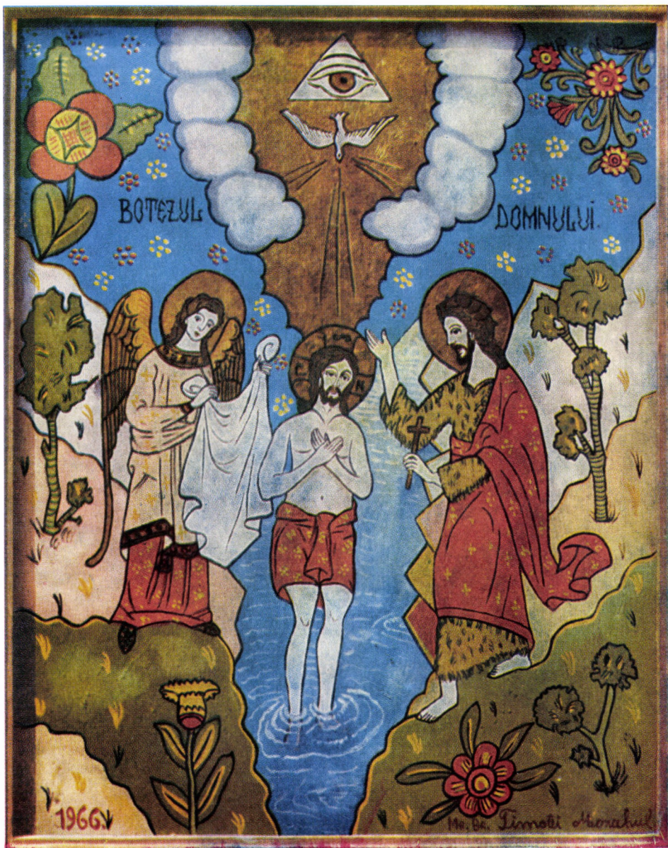
Icoană pe sticlă executată de Arhim. Timotei Tohăneanu de la Mănăstirea Simbăta