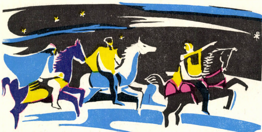
Cei ce slujeau stelelor, de la stea au învățat să te cunoască pe Tine, Soarele dreptății