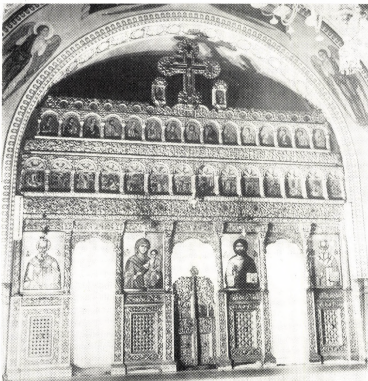
Iconostasul capelei Institutului (sec. XVIII)