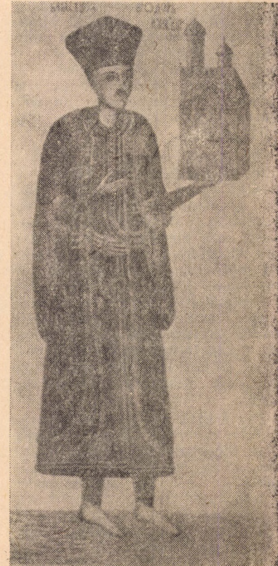
Tudor Vladimirescu. Portret voliv din Biserica Prejna (Mehedinți)

Astfel, Biserica Ortodoxă Română s-a făcut părtaşă întru cîntorirea unui nou ev în istoria și lupta milenară a neamului pentru independență, dreptate socială, apărarea ființei și demnității naționale.