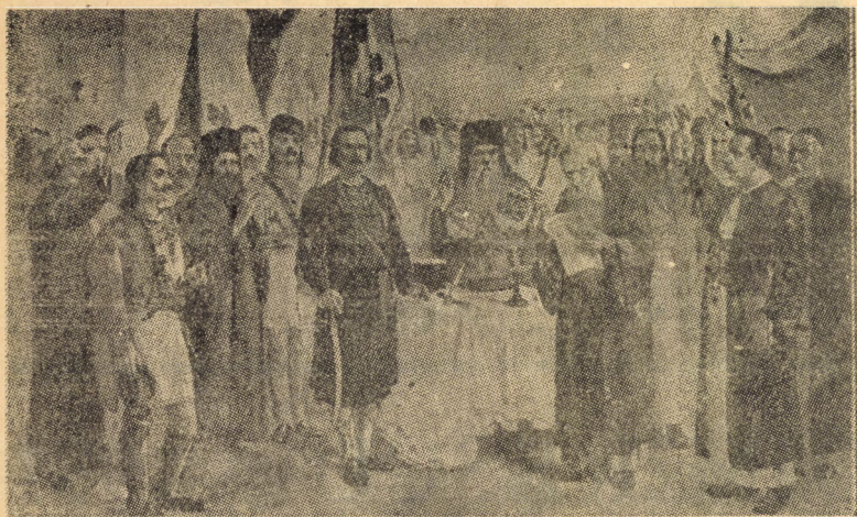
Tudor Vladimirescu primind jurământul de credință la Cotroceni