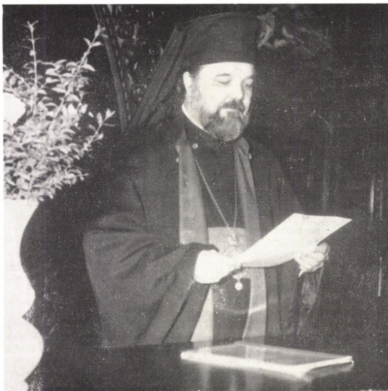
Înalt Prea Sfințitul Dr. Antonie Plămădeală, nou alesul Mitropolit al Ardealului, rostind cuvântarea în fața Colegiului Electoral

Este de datoria noastră însă ca în cadrul acestui moment solemn să închinăm mai întâi un gând bun și să rostim un cuvânt izvorât din inimă înaltului ierarh care