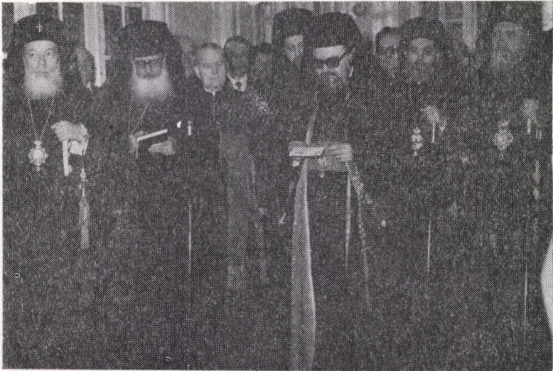
I. P. S. Mitropolit Antonie rostind cuvântarea la înmănarea decretului