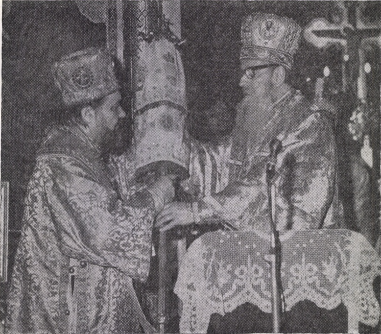
Inmânarea cîrjei de arhipăstor