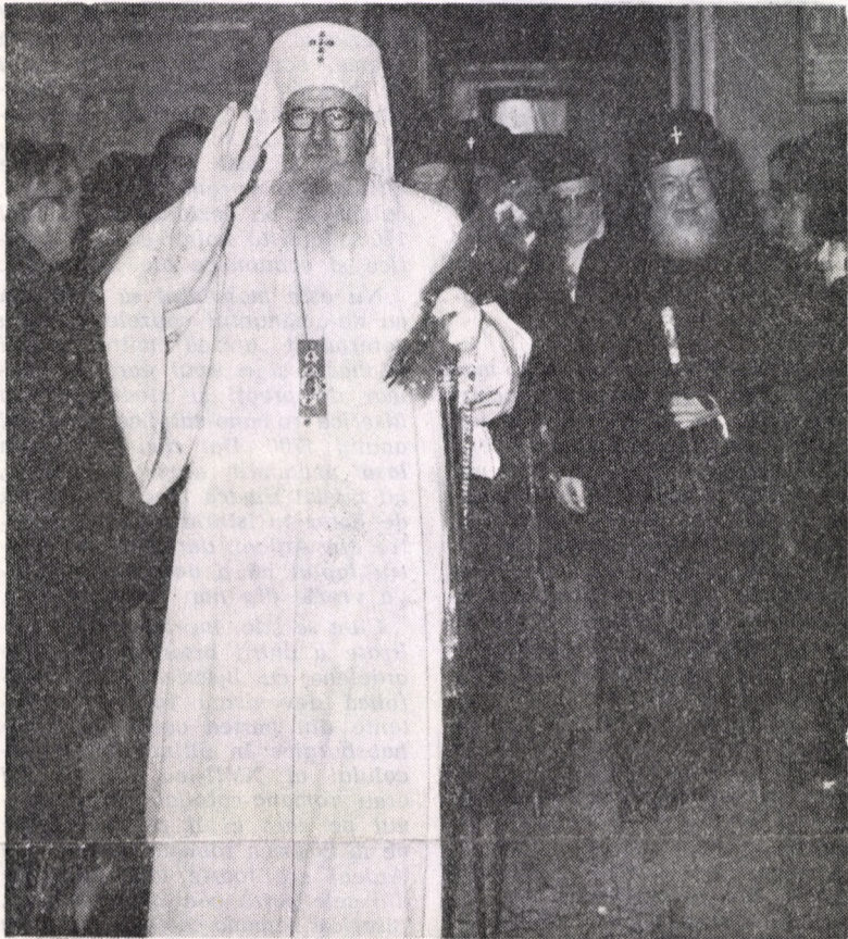
Sosirea P. F. Părinte Patriarh Iustin în gara Sibiu

Ales în scaunul de Arhiepiscop al Sibiului și Mitropolit al Ardealului de către Colegiul electoral bisericesc, la data de 10 ianuarie 1982, Înalt Prea Sfințitului Dr. Antonie Plămădeală i-a fost înmănat, într-un cadru festiv, la Departamentul Cultelor, Decretul prezidențial de recunoaștere în această înaltă funcție, în ziua de 5 februarie 1982.