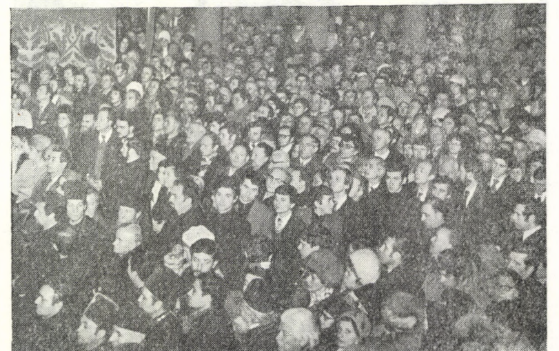
La instalare: aspect din Catedrala mitropolitană din Sibiu