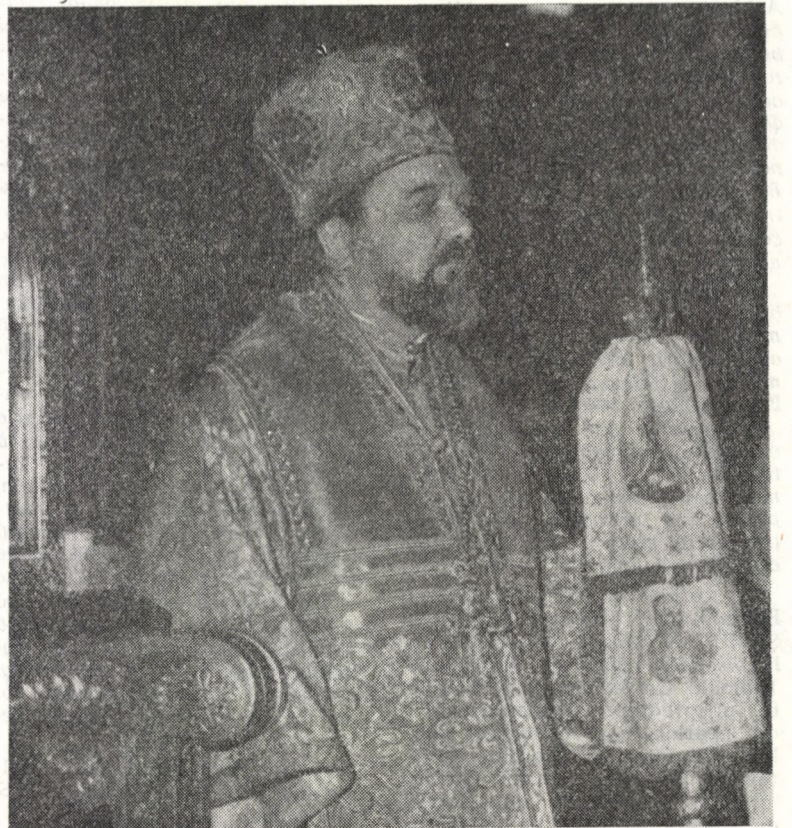
Instalarea în scaunul mitropolitan