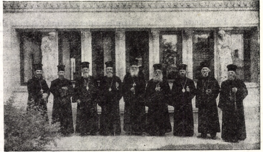
Mitropolitul Nicolae Bălan în mijlocul ierarhilor, prezenți în Sibiu, la Rusaliile anului 1936

Noi afirmăm astăzi în toate împrejurările că sîntem și am fost întotdeauna o Biserică a poporului, din popor și pentru popor. Înaintea noastră a spus-o și Nicolae Bălan, în același an 1925, la Stockholm, chiar cu cuvintele acestea: „Biserica română este cu adevărat o Biserică a poporului”. El înțelegea legătura cu poporul și ca pe o legătură cu națiunea, anticipînd ceea ce gîndim și noi astăzi: „Sub raport religios, națiunile se talmăcesc ca tot atîtea