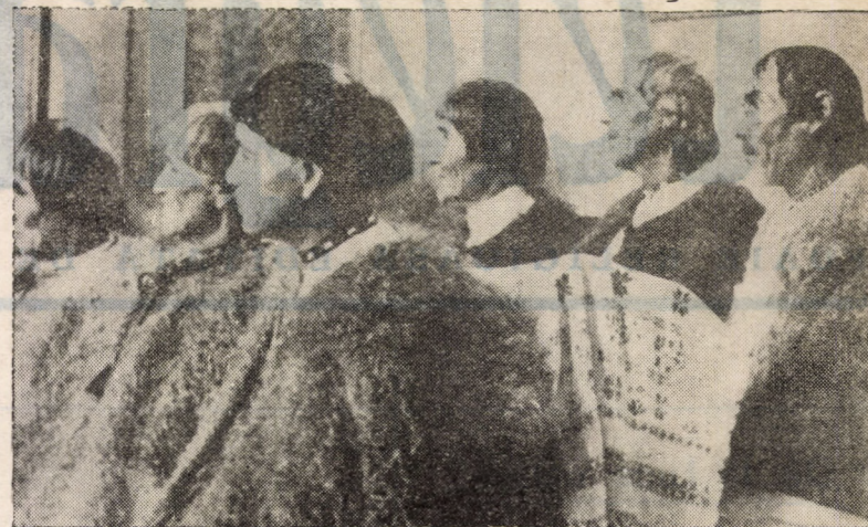
Români maramureșeni în timpul Sf. Liturghii. Este izbitoare asemănarea cu strămoșii noștri daci.