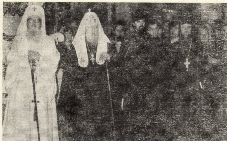
Înalții ierarhi în catedrala mitropolitană din Iași

În cuvîntul de răspuns, Întîistătătorul Bisericii Ortodoxe Ruse