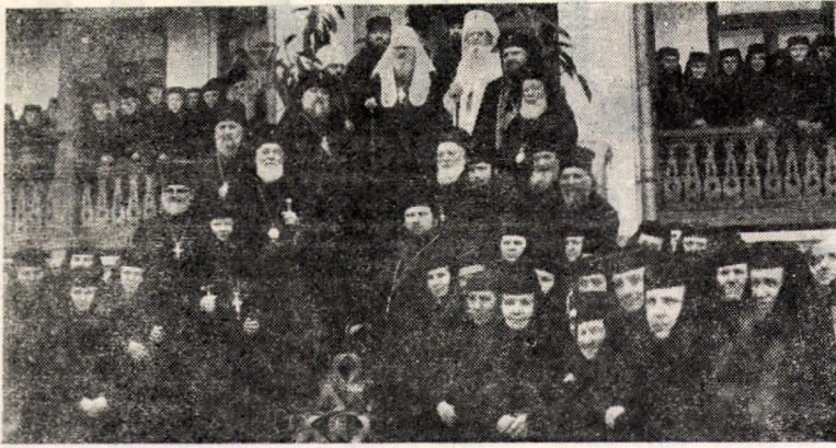
Înălții ierarhi în vizită la Mănăstirea Agapia