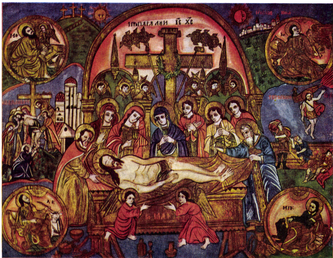
„Punerea în mormânt”, pictură pe sticlă, de Savin Moga, 1850