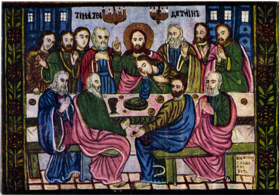
„Cina cea de Taină”, icoană pe sticlă din Valea Șebeșului, 1892

Am văzut că la Cina cea de Taină, Mîntuitorul transformă în