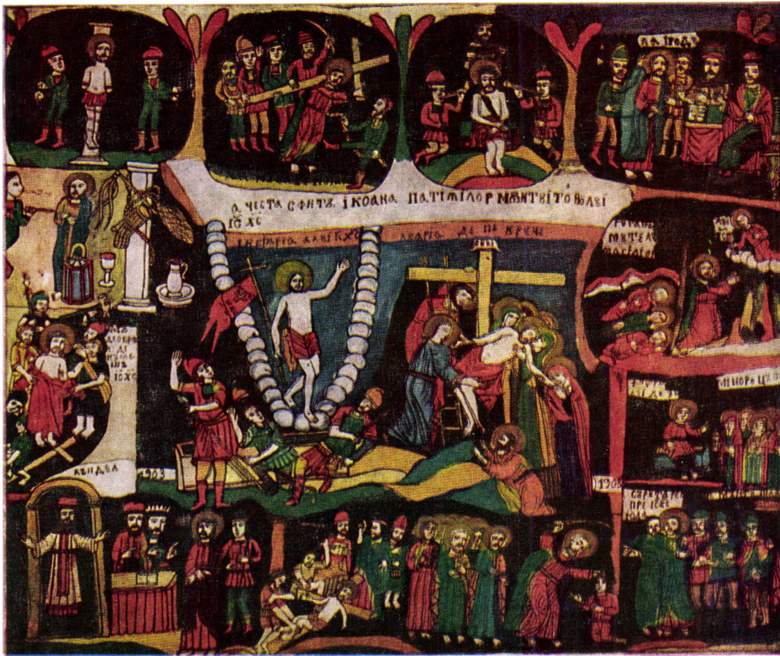
„Patimile Domnului”, pictură pe sticlă de Matei Timofora, 1903

Am înfățișat cîteva tradiții pascale, unele din ele puternic ancorate în Sfînta Scriptură și în Sfînta Tradiție, iar altele au la bază logica și rațiunea.