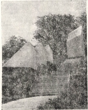
Monumentul de la Treznea ridicat în memoria celor 86 de români masacrați de către horthyști la 9 sept. 1940.

„În ziua de 24 septembrie 1940, cînd, împreună cu alți consăteni, femeii și bărbați, am mers la tirgul săptămînal de la Crasna, să fac unele cumpărături, la intrarea în localitate, am fost opriți de către un grup de horthyști civili și militari.