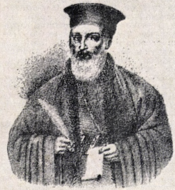
442. Gherasim Georǒievič, epișcop publicist

Aflîndu-mă, în septembrie 1985 la Belgrad, ca oaspete al Academiei de Științe sîrbe, la biblioteca prestigioasă instituții, am dat de o carte rară, o istorie în versuri și proză a Serbiei moderne, tipărită la 1838. Titlul exact al cărții este: „Znamenitii dogadani novije Srbske istorije” (Evenimentele importante ale istoriei moderne a Serbiei), formatul cărții 8, însumează 124 pagini și a fost tipărită la Belgrad în tipografia prințului din acel timp, Miloș Obrenovic.