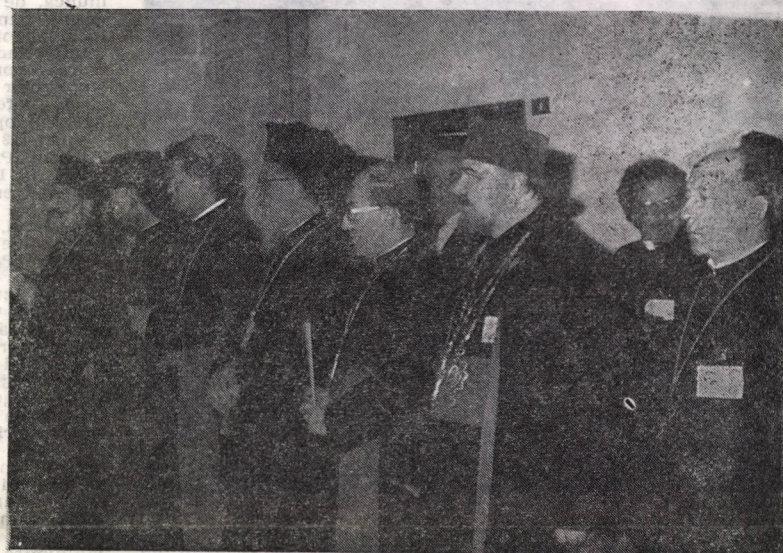
Bisericii”, având ca subiect Tainele de inițiere, adică Botezul, Mirungerea și Euharistia, n-au putut ajunge la un numitor comun, nu s-a putut realiza un acord între părți.

Sesiunea din 1986 a Comisiei internaționale mixte de dialog dintre Biserica Ortodoxă și Biserica Romano-catolică s-a încheiat la Bari-Italia printr-un eșec. Două Biserici, a Greciei și Patriarhia Ierusalimului, au refuzat să participe, altele două s-au retras în timpul lucrărilor — a Serbiei și a Ciprului — și altele n-au participat din motive „obiective”. Sesiunea s-a încheiat, după festivități locale frumoase, fără a putea încheia un document final. E drept că s-a dorit ca toate Bisericile ortodoxe să subscrie documentul, de aceea a fost lăsat deschis până la o nouă întâlnire, dar motivul amânării n-a fost numai acesta. Discuțiile asupra temei „Credința, Tainele și unitatea