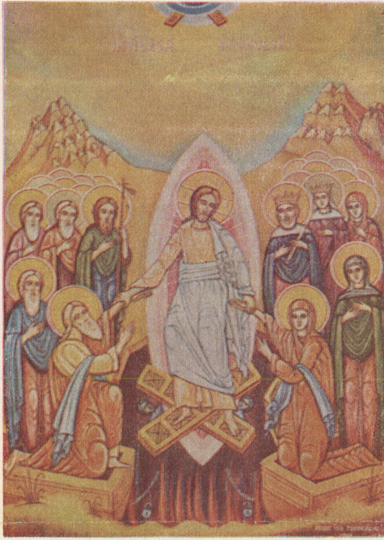
Hristos a înviat din morți, cu moartea pe moarte călcînd și celor din mormînturi, viață dăruindu-le.