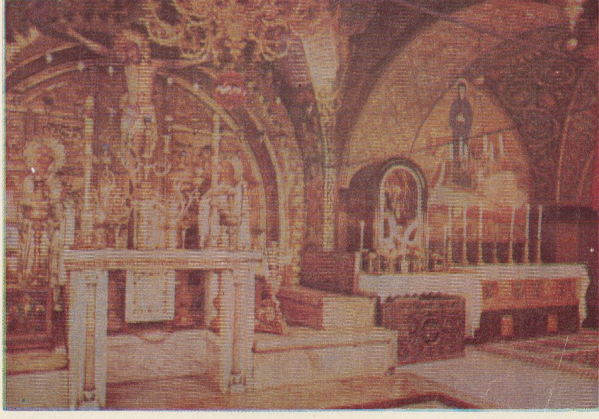
„Învierii lui Hristos vîzînd, să ne închinăm Sfîntului Domnului Iisus celui fără de păcat. Crucii Tale ne închinăm Hristoase și sfîntă Învierii Ta o lăudăm și o mărim, că Tu ești Dumnezeuul nos- tru, afară de Tine pe altul nu știm, numele Tău numim. Veniți toți credincioșii să ne închinăm

Sfîntei Învierii lui Hristos, că iată a venit prin Cruce, bucurie la toată lumea, totdeauna binecu- vîntînd pe Domnul, lăudăm Învierii Lui, că răstîg- nire răbdînd pentru noi, cu moartea pe moarte a stricat”