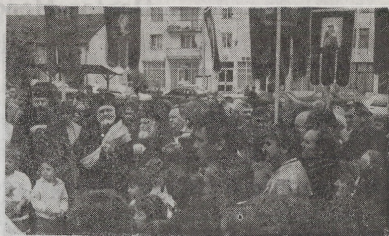
Aspect din timpul vizitei la Beiuș

„Lumnezeu a rânduit ca vizita la Oradea să fie tocmai în preajma praznicului Înălțării Domnului, când Biserica noastră cinsteș-