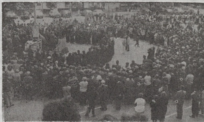
În mijlocul clerului și credincioșilor beiușeni

pe preoți să nu îngăduie ca acei pretinși „evangheliști“ să propovăduiască prin orașele și satele noastre. Rog autoritățile de stat să sprijine această lucrare de apărare a spiritualității românești“. Abordând și problema navetismului, Prea Fericirea Sa a spus: „Un mare neajuns este acela că mulți preoți nu locuiesc în parohiile lor. Trebuie să ne preocupăm această problemă și să ne silim cu toții ca preotul să locuiască în parohie pentru a putea pune