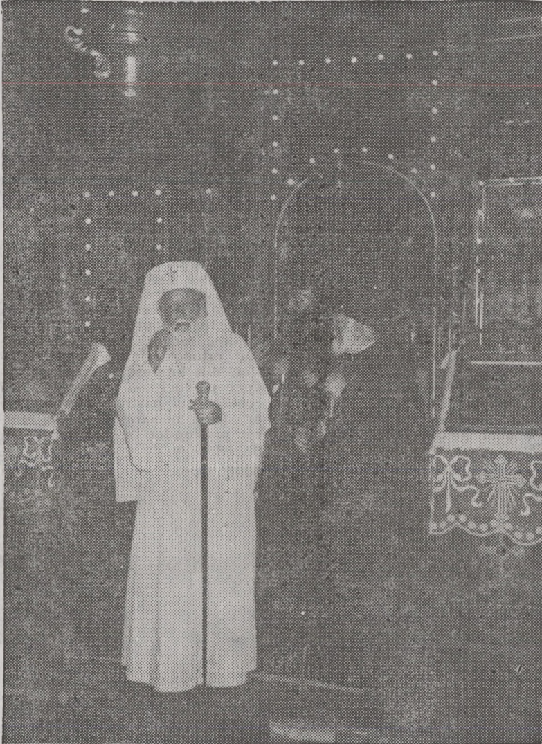
Popas la catedrala din Oradea, 3 iunie 1995

La ora 14, a avut loc sfințirea, de către Prea Fericitul Părinte