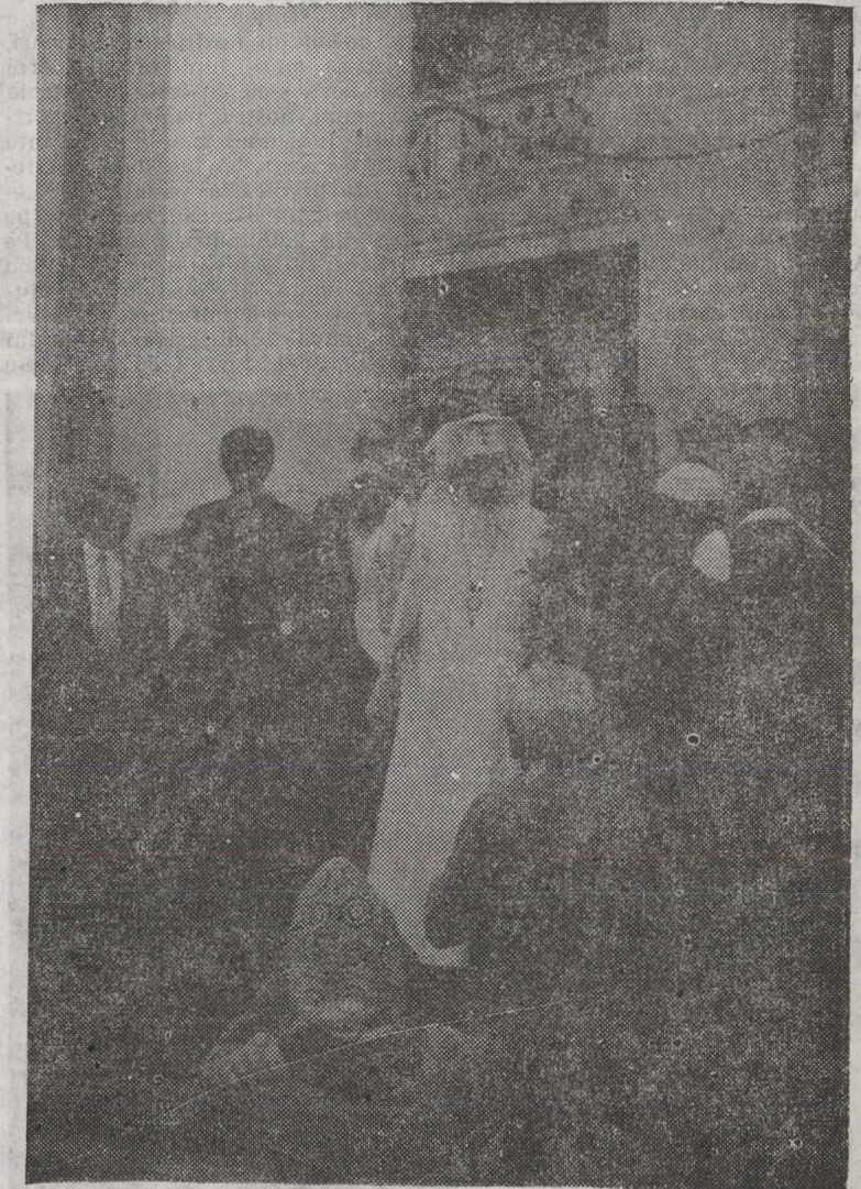
Pe scările teatrului de Stat din Oradea, după acordarea titlului