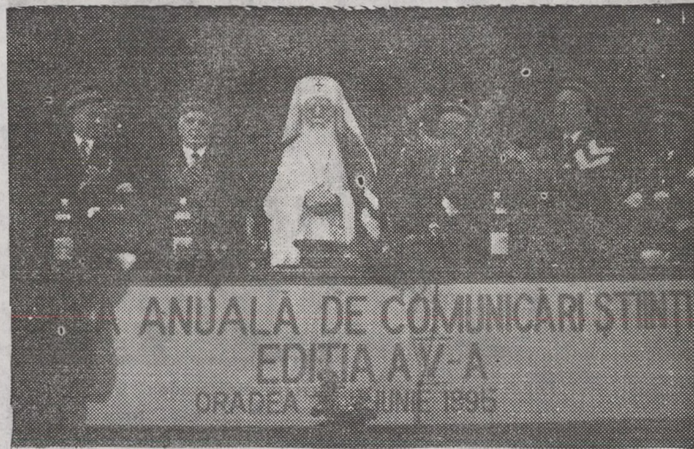
După acordarea titlului P. F. Patriarh Teoctist, purtând toga de membru al Senatului Universității Oradea