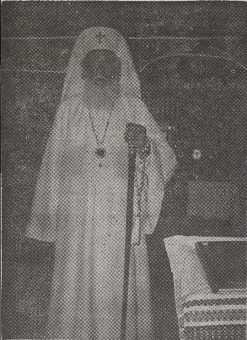
Popas în biserica Universității din Oradea