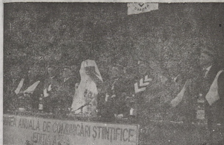
Dl. Rector al Universității Oradea dă citire diplomei de „Doctor Honoris Causa” acordată P. F. Patriarh Teoctist

În după masa aceleiași zile, la reședința episcopală s-au derulat lucrările sinodului mitropolitan al Ardealului, care a discutat între altele probleme și problema relației cu catolicii de rit bizantin.