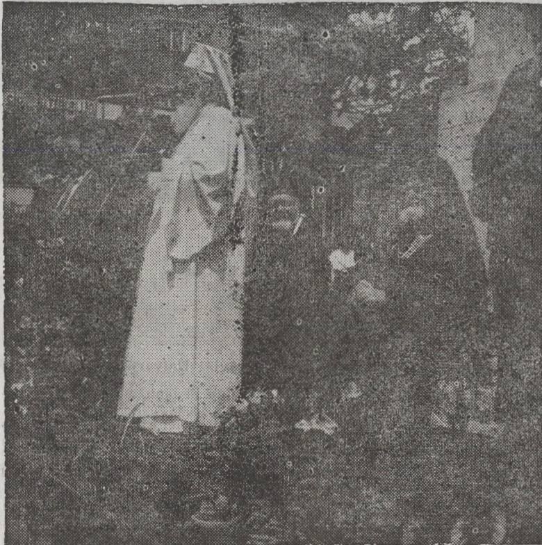
P. F. Patriarh Teoctist adresându-se credincioșilor din Beiuș

Următorul popas a fost la frunța parohie Ceica, unde de asemenea Prea Fericitul Părinte Patriarh Teoctist a fost așteptat de un număr impresionant de preoți și credincioși. Aici, la Ceica, s-a înălțat de curând un frumos monument dedicat eroilor neamului.