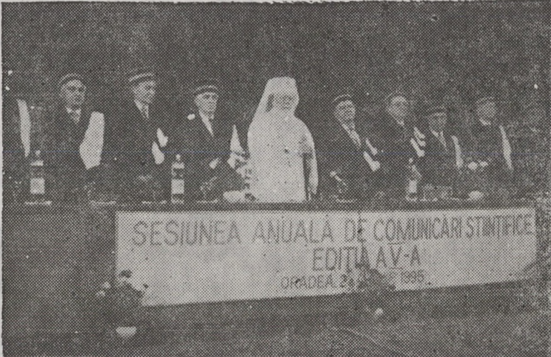
La teatrul de stat. În mijlocul Senatului Universității Oradea

Și cu acest prilej, Prea Fericitul Sa a rostit un scurt cuvânt arătând importanța cu totul aparte a epocii brâncovenesti în