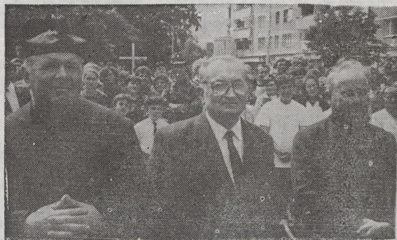
Reprezentanți ai altor confesiuni prezenți la manifestarea de la Beiuș

O remarcă specială a făcut Prea Fericirea Sa la predarea religiei în școală, apreciind că „e o mare