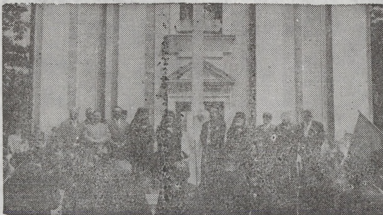
Solemnitatea primirii în fața catedralei din Beiuș

Prea Fericirea Sa a arătat apoi, că și vecinii noștri din vest, respectiv ungarul, au primit la venirea lor în Europa creștinismul ortodox, de la Bizanț. Ulterior, din interese politice au devenit catolici sau protestanți. Noi românii am păstrat cu strășnicie ortodoxia noastră, în ciuda tuturor presiunilor ce s-au făcut să ne lepădăm de ea.