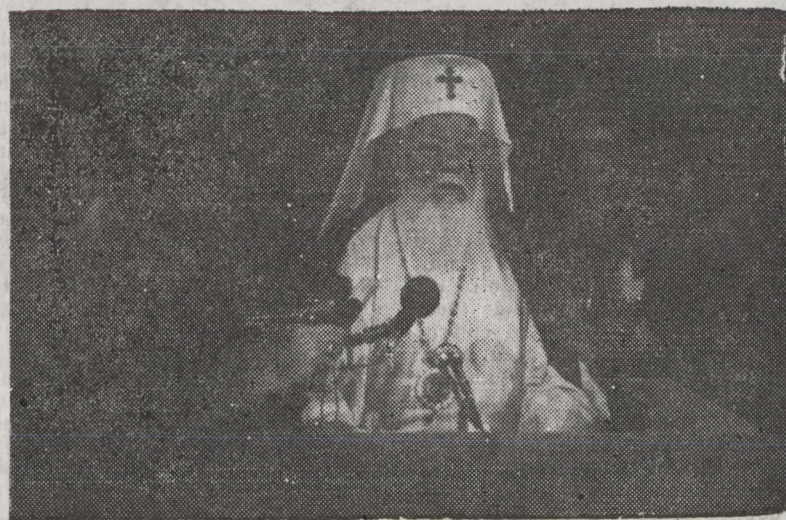
Cuvântul P. F. Patriarh Teoctist după acordarea titlului

Am reflectat de acasă la o temă pe care am intitulat-o: „Cultură și Biserica” și pe care intenționez să o prezint, cum se obișnuiește, în astfel de împrejurări, în fața Domniilor Voastre. Regăsindu-mă însă într-un moment atât de emoționant, m-am decis să încredințez Domnului Rector tema tratată, spre a fi eventual publicată în analele Universității și voi încerca să răspund cinstirii ce mi-ați făcut printr-o altă cuvântare, inspirată din sentimentele profunde trăite de mine astăzi.