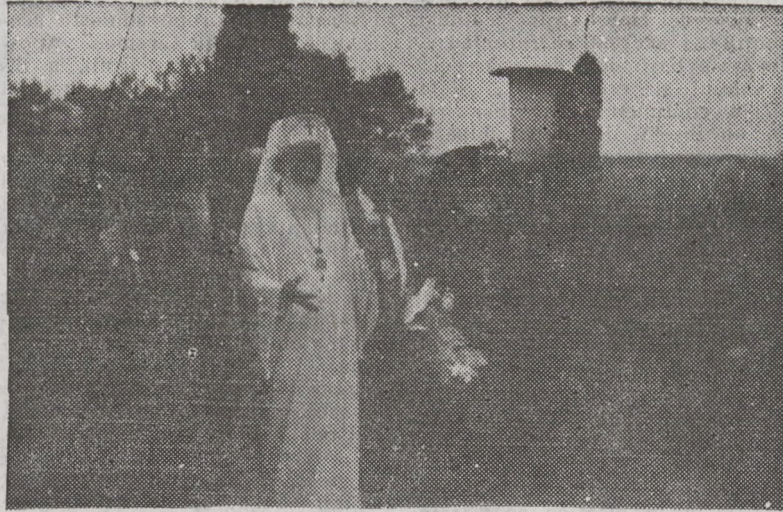
După sosire, pe aeroportul Oradea

Ca răspuns la acest act de cinstire, Prea Fericitul Părinte Pa-