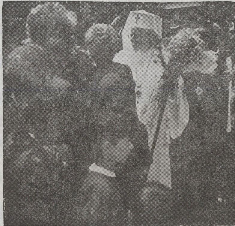
În timpul vizitei la Beiuș (3 iunie 1995)

Ca peste tot pe unde a trecut, și în orașul Beiuș, centru de cultură, de credință și luptă românească, Prea Fericitul Părinte Pa-