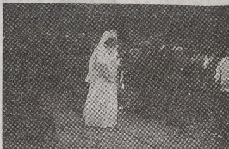
În incinta Universității din Oradea