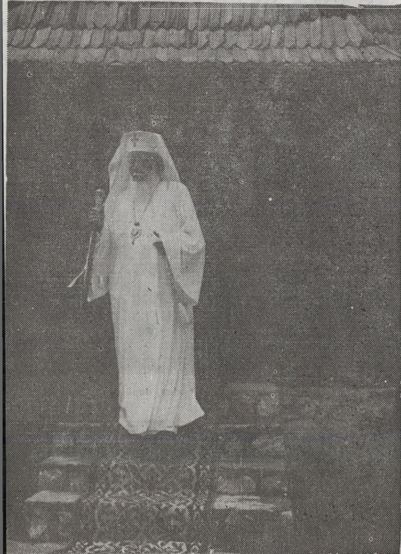
După vizitarea bisericii Universității din Oradea

Referindu-se la amplasarea mănăstirii pe un povârnis de deal lângă Oradea, Prea Fericirea Sa a spus: „Parcă de aici S-a înălțat Mântuitorul la cer. Parcă de aici a răsunat glasul Lui și încredințarea pe care Le-a dat-o Apostolilor de a fi cu ei, până la sfârșitul veacurilor. Cine altcineva — a continuat Prea Fericirea Sa, ne-ar fi putut aduna astăzi, aici, într-un număr atât de impresionant, dacă nu Domnul nostru Iisus Hristos, pe care îl vedem cu ochii credinței. În bisericile și mănăstirile noastre, nu s'adunările sectanților, unde sunt tot felul de capcane sufletești. Îl aflăm și suntem împreună cu Mântuitorul Hristos“. Continuând apoi, pe un ton apologetic, Prea Fericirea Sa a spus: „Păziți-vă