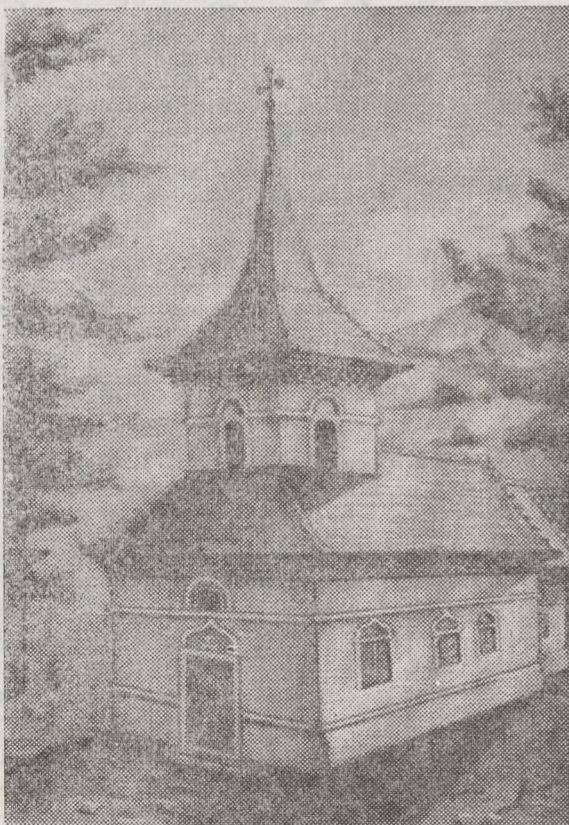
„Căci noi ai lui Dumnezeu împreună-lucrători suntem; voi sunteți ogorul lui Dumnezeu zidirea lui Dumnezeu.”