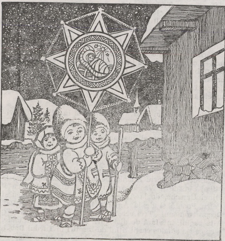
(Urmare din pag. a 6-a)

trivite cu spiritul și cu datinile noastre”.