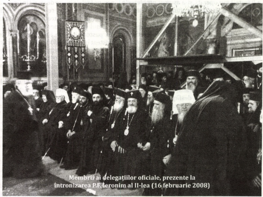
Membrii ai delegațiilor oficiale, prezente la întronizarea P.F. Ieronim al II-lea (16 februarie 2008)

Nu a lipsit din mesajul Prea Fericirii Sale focalizarea pe nucleul vieții parohiale: „Îmi doresc, mă rog și vă rog să vă preocupați astfel încât, în pustiul Atenei să existe o mică oază pentru tineret în fiecare parohie... Este urgent și necesar ca în fiecare colț de pământ atenian să existe o parohie vie, care să arate în orice fel posibil, că Hristos a înviat, și de aceea oamenii pot să găsească acolo bucurie, consolare, sprijin, sens vieții lor; și să trăiască viața de zi cu