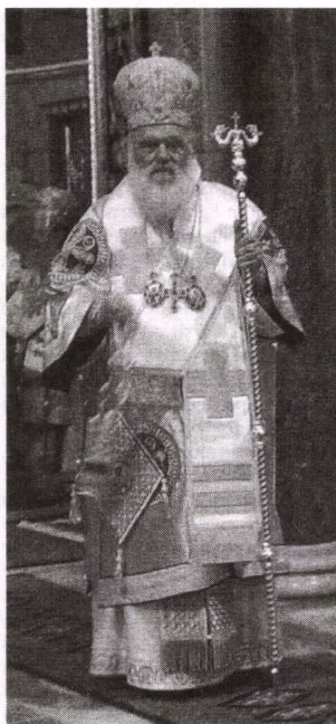
PF Ieronim II, slujind prima sa Liturghie în demnitatea de Arhiepiscop al Atenei și al întregii Grecii, 17 februarie 2008

Din data de 7 februarie a.c., Prea Fericitul Părinte Ieronim al II-lea este noul Arhiepiscop al Atenei și al întregii Grecii. Prea Fericirea Sa a fost ales în această nobilă slujire de către ierarhia Bisericii Ortodoxe a Greciei, cu 45 de voturi din totalul celor 74 exprimate, devenind astfel cel de al XX-lea Arhiepiscop al Atenei și al întregii Grecii.