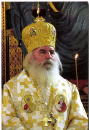
† Arhiepiscop IOAN SELEJAN al Episcopiei Covasnei și Harghitei, Mitropolit ales al Banatului