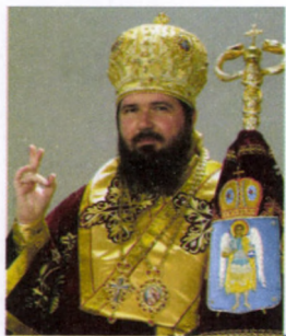
† SOFRONIE, Episcop al Oradiei