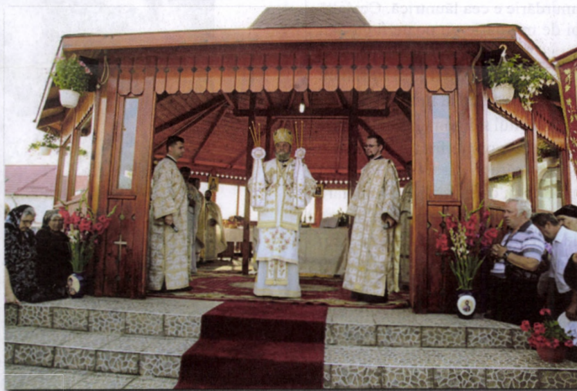
Sărbătoarea hramului de la Mănăstirea „Sfântul Prooroc Ilie Tesviteanul” din Pelisoar, județul Sibiu

Sărbătoarea hramului este un prilej de sfințire și de mare bucurie duhovnicească pentru toți fiii spirituali ai Bisericii. În această comuniune spirituală sunt cuprinși și cei plecați din lumea aceasta – cei adormiți în Domnul – preoți slujitori, „enoriași, ctitori și binefăcători”, fiind pomeniți la Sfânta Liturghie și la slujba parastasului. Toți cei care au devenit membri ai Bisericii, prin Taina Sfântului Botez, primită în locașul de închinare, atât cei vii, cât și cei morți, se vor bucura de „pomenirea numelor lor” și de „prezentarea lor”, cu „tot neamul lor”, în fața lui Dumnezeu, pentru a-și aduce pururea aminte de ei.