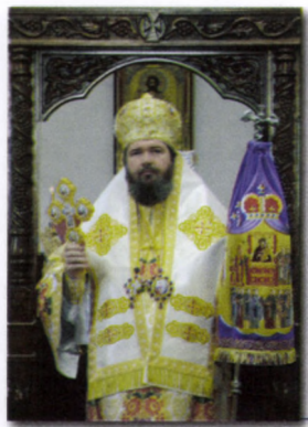
† SOFRONIE, Episcop al Oradiei