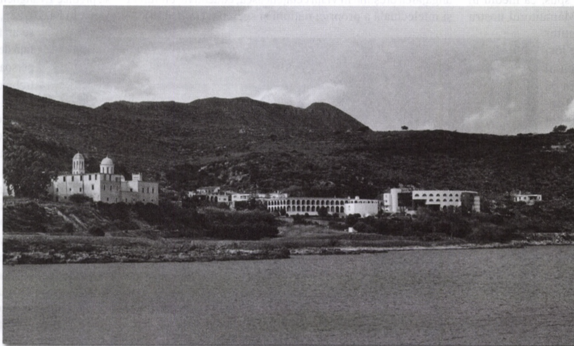
Academia Ortodoxă din Insula Creta

practicii bisericești dintotdeauna (διαχρονική) cu privire la modul de funcționare sinodal, în Biserica cea Una, Sfântă, Sobornicească și Apostolească, și este convocat de către Sanctitatea Sa, Patriarhul Ecumenic, pe baza consensului Preafericiților Întâistătători ai tuturor Bisericilor Ortodoxe Locale, recunoscute în mod universal ca și autocefale. El va fi compus din membri desemnați, ca parte a delegațiilor acestora.